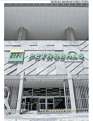
Petrobras negocia aumento

— Muitas fábricas podem ficar inviáveis economicamente por conta do aumento do preço do gás. E a indústria vai repassar isso para tudo, desde o frango congelado até a lata de cerveja e o preço do carro. z