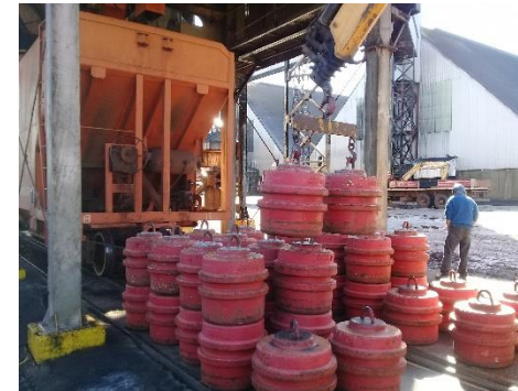
PESAGEM DE VAGÃO