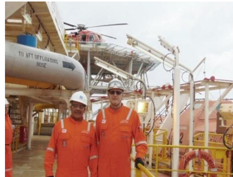
PLATAFORMA DE PETRÓLEO