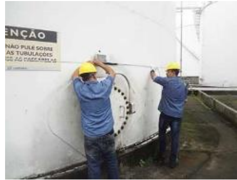
ARQUEAÇÃO DE TANQUES