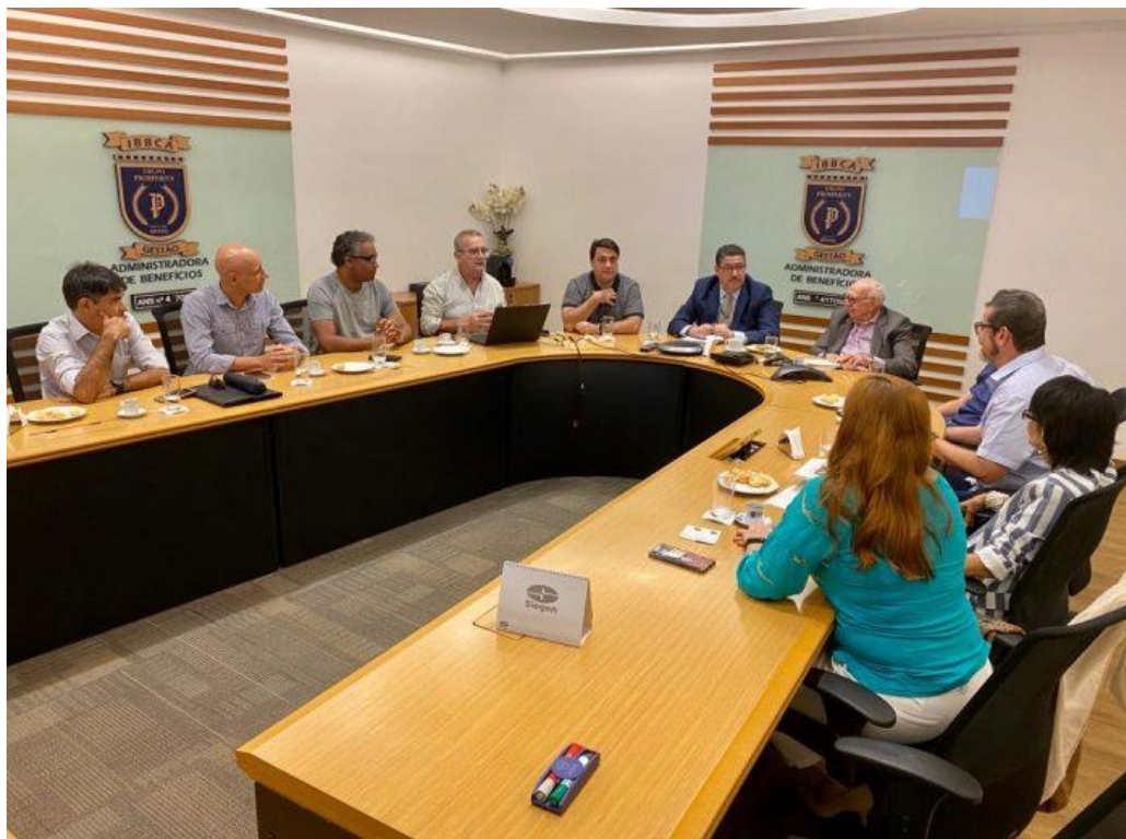
Reunião do grupo gestor de saúde suplementar do ASMETRO-SN, CVM e INPI com o IBBCA